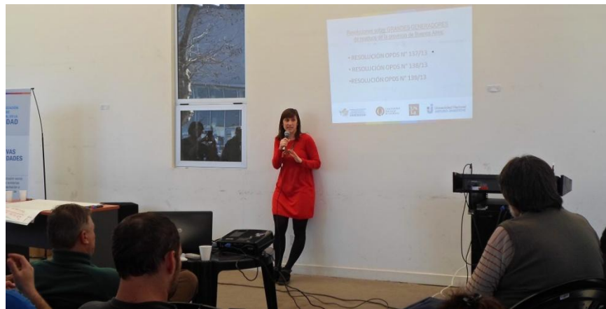
Presentación de las Resoluciones 137, 138 y 139 del 2013 del OPDS