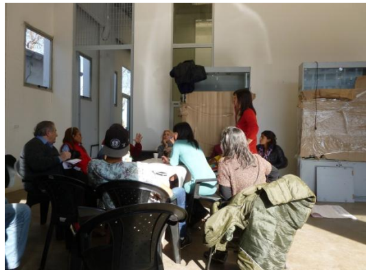
Mesa 1: Información y acceso como destino sustentable. Mesa 2: contacto y diálogo con los GG