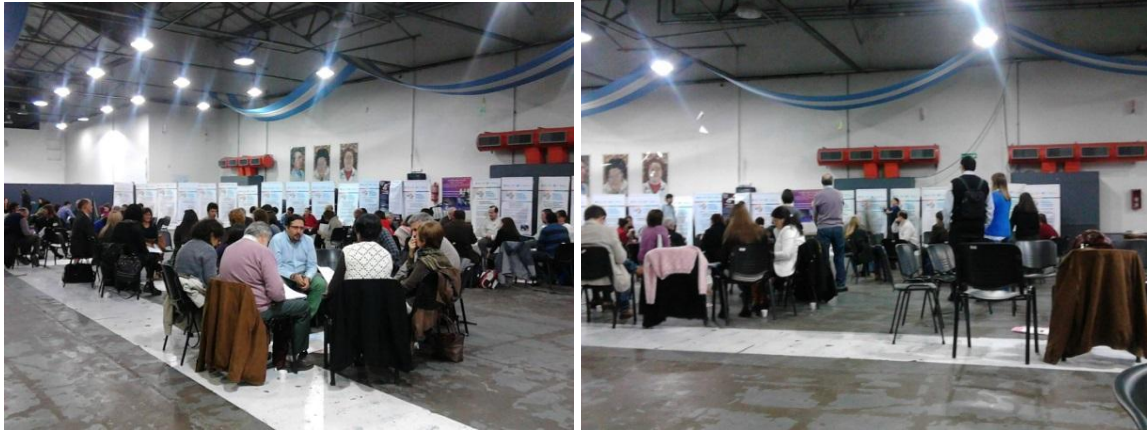
Miércoles 7 de octubre: Taller de intercambio de experiencias