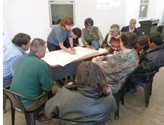
Mesa 4: relación con otros actores