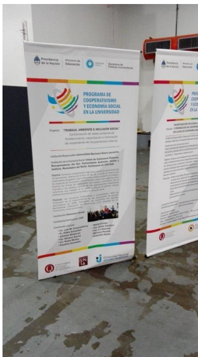
Muestra de Banners de los Proyectos

Los integrantes del equipo participamos del I Encuentro Nacional “Universidad, cooperativismo y economía social. Experiencias de investigación aplicada y trabajos en redes” en el marco del “PROGRAMA DE EDUCACIÓN EN COOPERATIVISMO Y ECONOMÍA SOCIAL EN LA UNIVERSIDAD” de la Secretaría de Políticas Universitarias del Ministerio de Educación, realizado el 6 y 7 de octubre de 2015 en la sede del Ministerio de Educación de la ciudad de Buenos Aires y del E ENCUENTRO DE TRABAJO de la Red Universitaria de Economía Social Solidaria realizado el 3 y 4 de Marzo de 2016 en el Centro Cultural de la Cooperación, Ciudad de Buenos Aires,