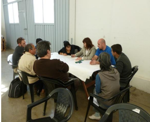
Mesa 3: transporte e infraestructura